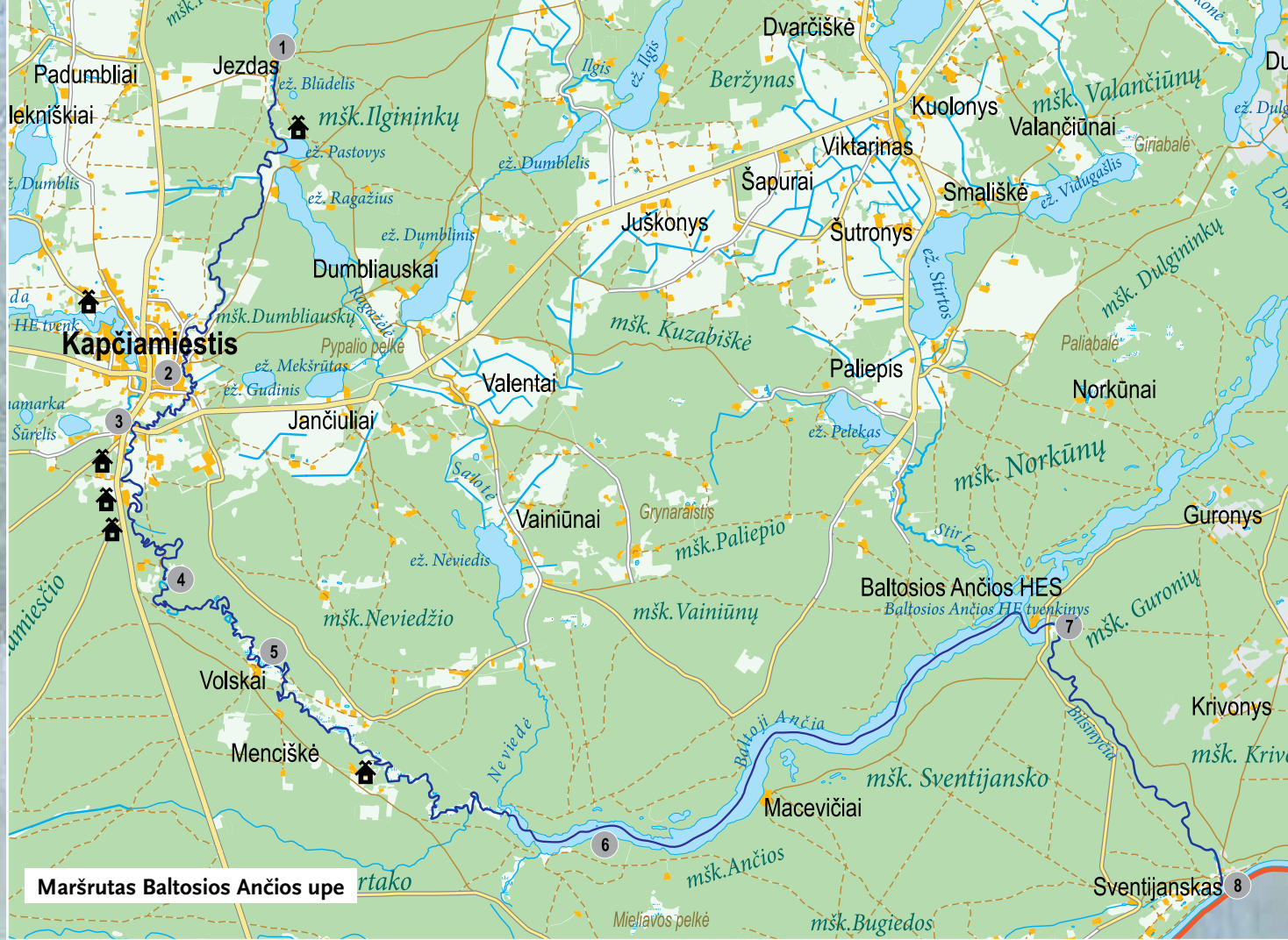
Maršrutas Baltosios Ančios upe